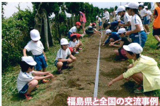
福島県と全国の交流事例

子どもたちで「旭南ひまわりプロジェクト」を立ち上げ、学校に約1000本ものひまわりを咲かせた。