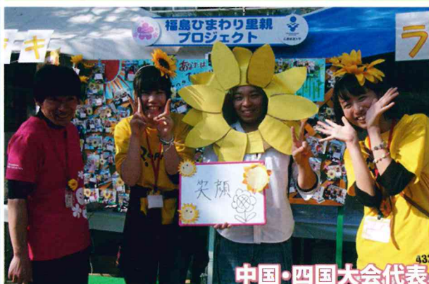
中国・四国大会代表

広島の被災地に「復興のシンボル」としてひまわりが咲き誇り、みんなの希望の花となった。