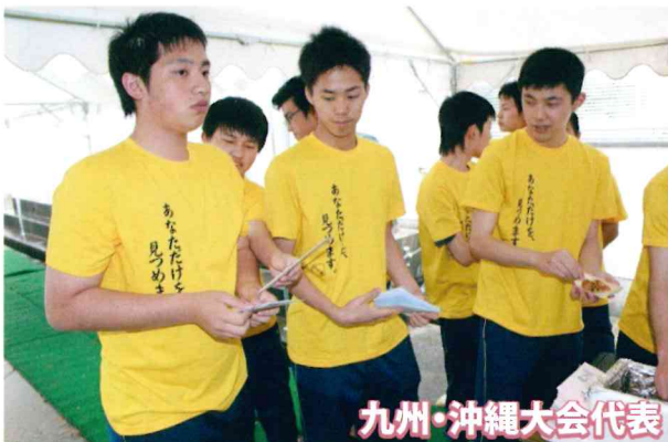
九州・沖縄大会代表

オリジナルのぼり旗、ひまわりカラーのTシャツを揃え、種を小分けにしたものを来場者へ配布したり、福島の復興支援を呼びかけるなど、高校生ならではのアイデアで展開した取り組みを行った。