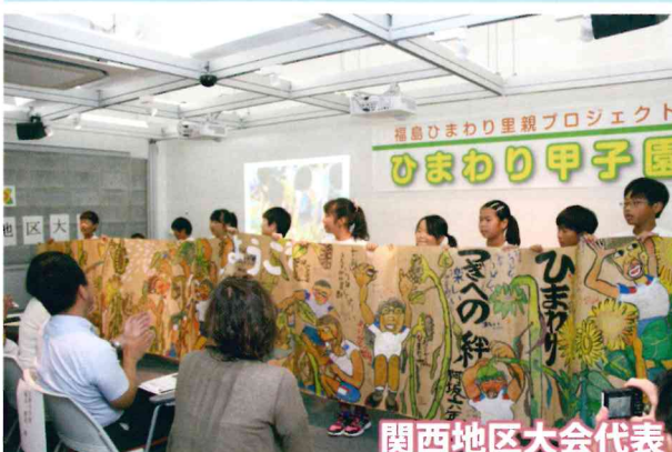
関西地区大会代表