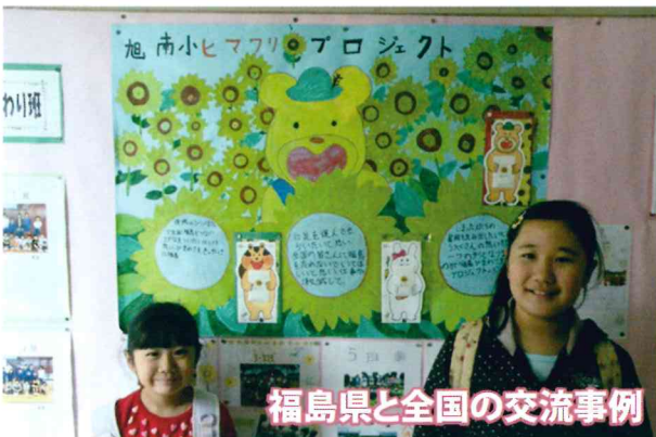
福島県と全国の交流事例

2015年度よりチームふくしま最年少理事として、ひまわり甲子園地方大会で参加者に向けて自身の震災経験の講話を行っている。