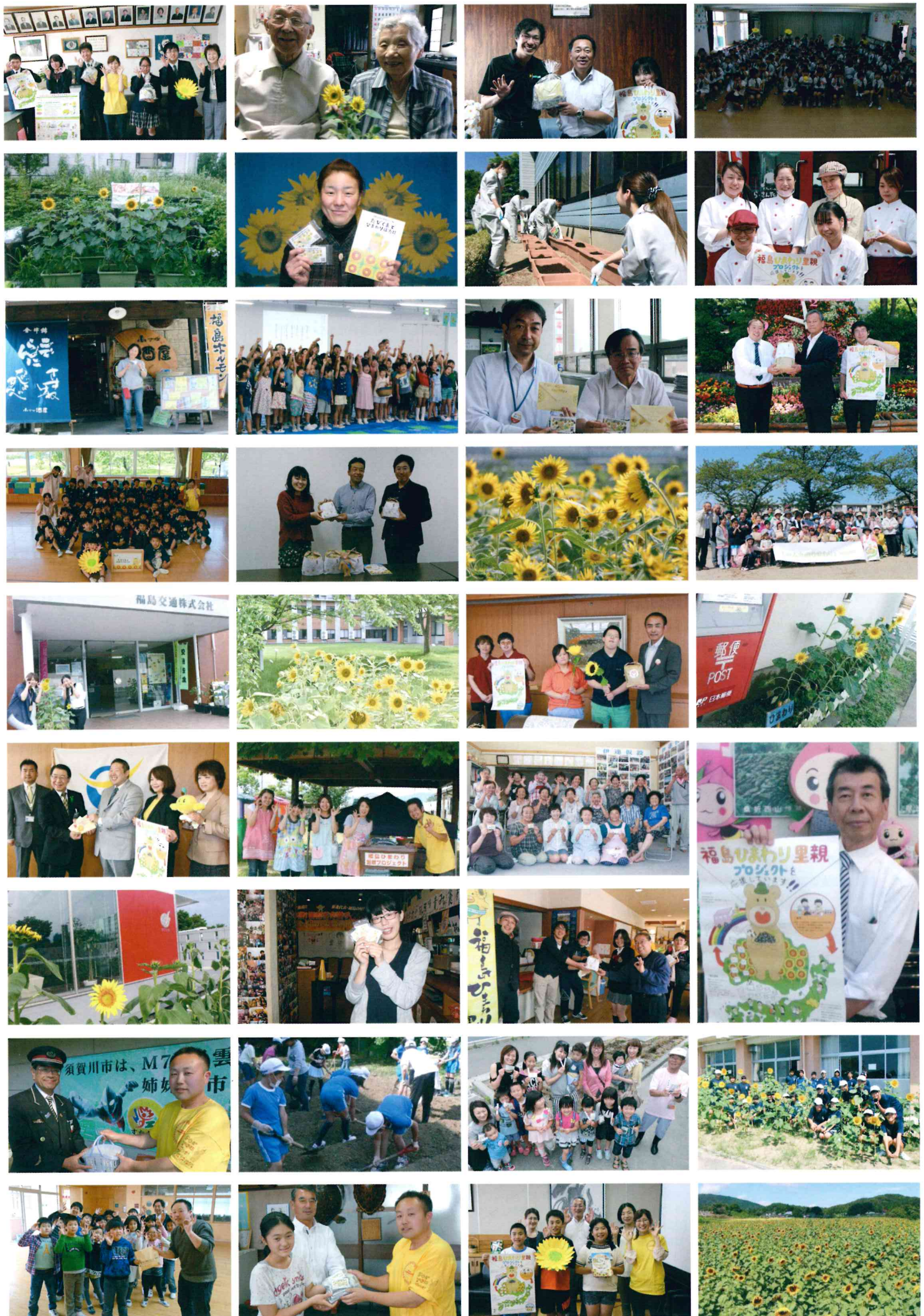
9 写真:プロジェクトにご協力いただいた福島県の皆さま(一部)