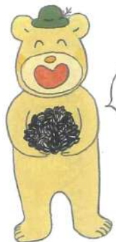
▲ たびくまくん 福島県に住んでいるよ